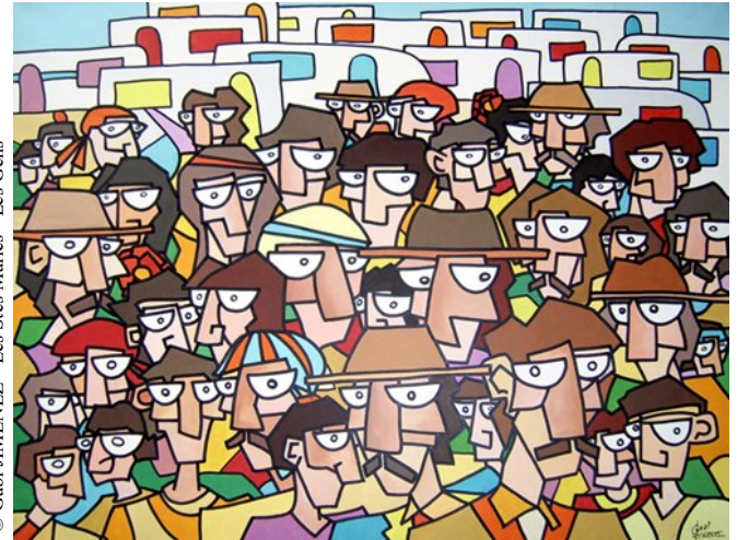
© Gabi JIMENEZ - Les Gens

Reclamé par certaines associations, un référent « Gens du Voyage » auprès du Ministre de l'Intérieur vient d'être nommé. Il s'agit de Philip Allon-