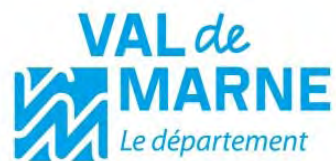
Schéma départemental d'accueil des gens du voyage du Val-de-Marne