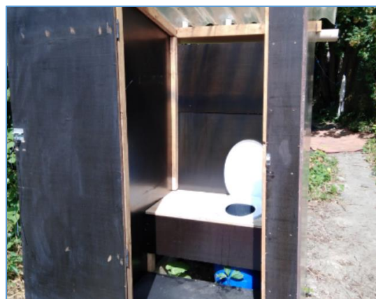
Toilette sèche installée sur le site de Cergy

Début 2020, le dépôt de bilan de Toilettes du Monde, principal financeur du projet, a entraîné le transfert de la propriété des sanitaires en direction des occupants du site. Des conventions tripartites entre chaque famille, ACINA et Les Gandousiers ont été signées de manière à organiser le versement par les habitants des sommes dues pour la vidange, le ravitaillement et l'entretien des équipements, l'association jouant un rôle d'intermédiaire (et de garant). Avec une dizaine de personnes en moyenne par sanitaire (les enfants de moins de 8 ans étant considérés comme des usagers non-payeurs), les montants demeurent abordables pour les foyers, excluant jusqu'à présent les situations d'impayés.