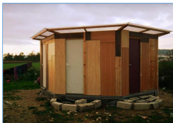
Équipement sanitaire installé sur le bidonville

fournie gratuitement par une scierie de Mantes-la-Jolie. Après présentation aux habitants, un mode d'emploi imagé a de plus été disposé dans chaque cabine de toilette afin d'en favoriser le bon usage.