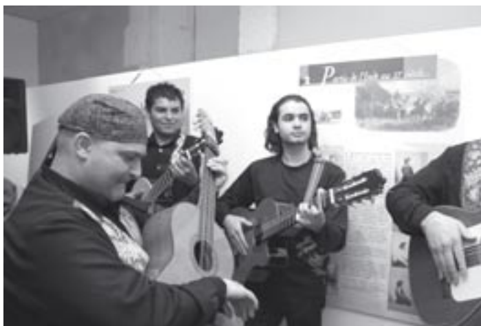
Inauguration de l'exposition « Un camp pour les Tsiganes » des archives départementales, fruit du travail de H. Asséo et M.-C. Hubert avec le photographe M. Pernot.