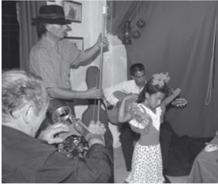
La musique... la fête... la danse... Certainement les dimensions les plus appréciées par les gadjé dans ce peuple ô combien discriminé ! (photo A. L.).

Alors, pourquoi ne pas y voir clair ? Est-ce de la cécité ? De la vision sélective ? Ou bien les Roms sont-ils un peuple opaque, renfermé sur lui-même ? Il y a un peu de tout cela. De la vision sélective, à coup sûr. Depuis le journal du Bourgeois de Paris, qui décrivait l'arrivée des premiers Roms à Saint-Denis au début du XV e siècle, à la législation sur les « Gens du Voyage », la vision n'a fait que se restreindre un peu plus. La France ne reconnaît pas de minorités sur son sol. La reconnaissance d'identités ethniques sur le sol français paraît contraire à la cohésion nationale. Or, puisqu'elles existent, il faut bien faire avec. On a alors choisi de les nommer autrement : « musulmans de France », « population issue de l'immigration », « gens du voyage », autant de feuilles de figuier ou de vigne non pour cacher ce qui ferait honte à ceux que l'on couvre, mais ce dont on croit qu'il mettrait en péril la cohésion sociale. Force est de constater que cela ne fait qu'empirer les choses, et les émeutes des banlieues comme les manifestations des Roms, Sintés et Kalés de France sont là pour en attester. Est-il si difficile de comprendre qu'être Rrom, Sinto ou Gitan n'empêche en rien d'être en même temps et autant Français, Auvergnat et Européen ? Effectivement, on avoisine la cécité. Depuis environ six siècles qu'ils sont ici, on ne veut tou-