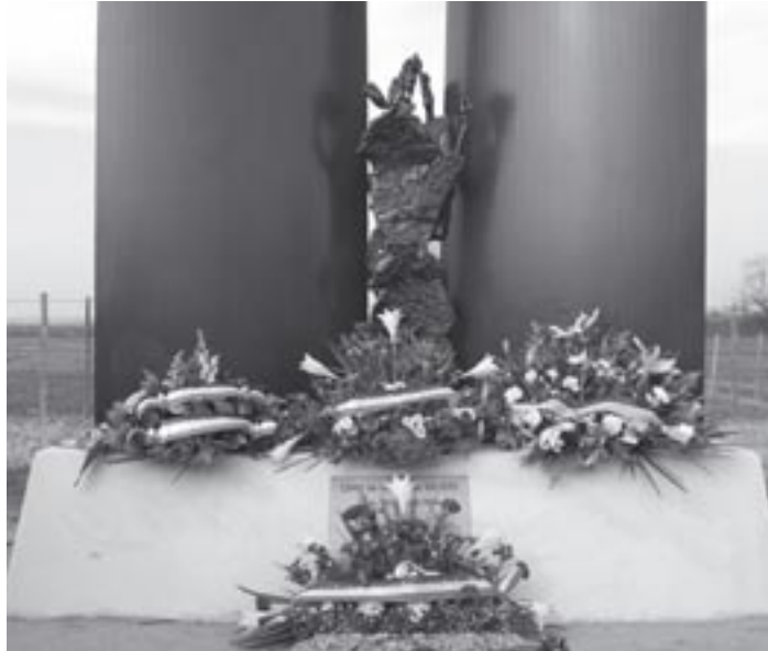
Le mémorial érigé en hommage aux 677 tsiganes internés dans le camp de Saliers en Camargue.

Cette extermination qui a eu lieu dans l'ensemble des pays d'Europe pendant la deuxième guerre mondiale, n'est pas sortie ex nihilo le jour de la déclaration de guerre. Elle s'est appuyée sur des mesures prises dans l'ensemble des pays européens, Europe de l'Ouest comme de l'Est. Une législation