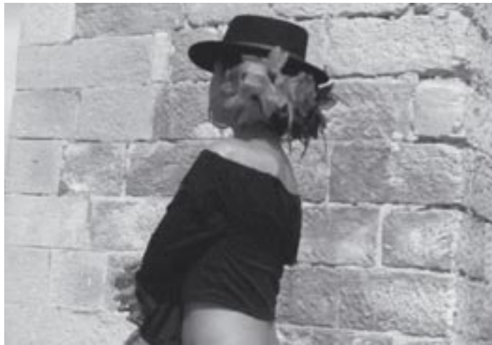
De la magie et du rêve pour les gadje, dans les pas de cette belle gitane.

Le poids d'un tel passé ne peut être sous-estimé, ni pour ce qui est de la production d'un destin collec-