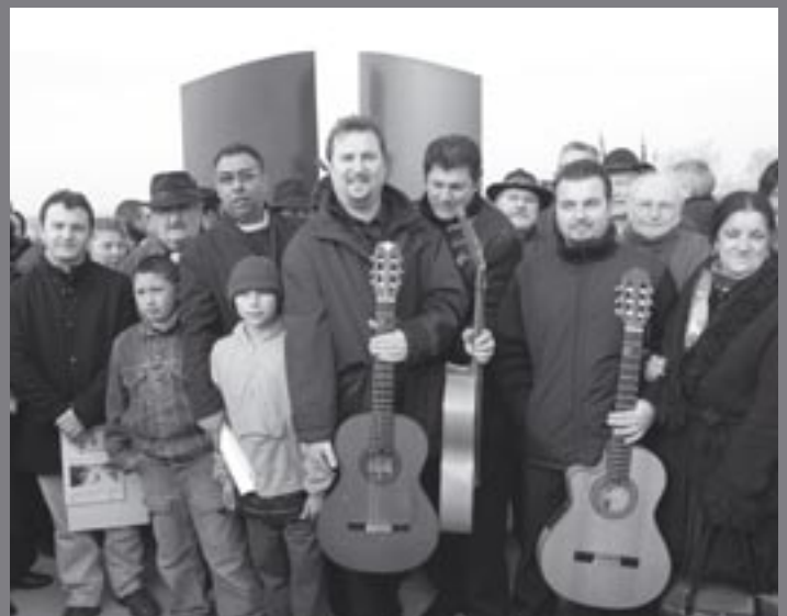
Après le recueillement, tous les Tsiganes présents ce 2 février 2006, ont manifesté leur joie de voir enfin reconnue cette période douloureuse de leur histoire.

Les intervenants de ce Colloque ont alors évoqué, raconté, l'histoire du camp, de sa construction (inache-