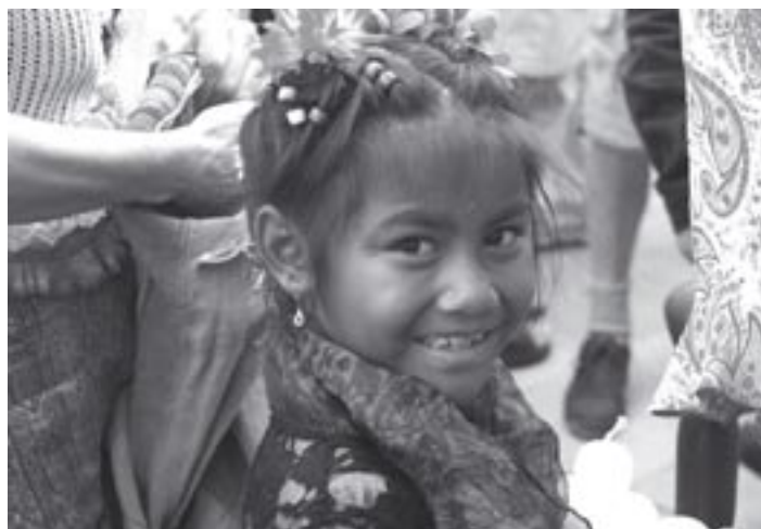
Le regard à la fois heureux et craintif de cette petite Tzigane invite au rêve d'un monde tout en couleurs....

● Celle de l'instrumentalisation de cette mobilité par bien des communes qui s'en servent comme prétexte à l'exclusion pure et simple des Roms mobiles de la vie sociale et de lieux de vie décents, en tablant sur le fait qu'il est inutile de se préoccuper de ces « éternels voyageurs » - qui de toute manière n'apportent (ou ne sont censés apporter) de bénéfice électoral à aucun élu ou candidat. Il leur semble bien plus profitable de courtiser un éventuel racisme des électeurs potentiels de la cir-