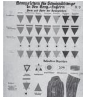
Classification des différents écussons que les déportés étaient contraints de porter. Le triangle marron était réservé aux Tziganes.

Ce ne sont pas les chiffres qui révèlent la force et l'importance de la question de la discrimination et de la persécution des Roms de citoyenneté française pendant la deuxième guerre mondiale, c'est l'insertion dans l'ensemble d'un programme politique dont ils sont membres à part entière. Les Roms ont fait partie du train des lois de Vichy contre tout ce qui bougeait et tout ce qui ne convenait pas au titre d'ennemi intérieur et ennemi extérieur et cela nous autorise à considérer que c'est une question d'une