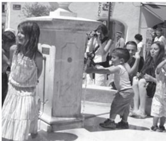
Des enfants tziganes aux Saintes-Maries-de-la-Mer.

pourrait comparer au dictionnaire de l'académie, établi à partir des parlers de milliers de locuteurs, la somme des vocabulaires de Roms de divers pays, mais cette entreprise est vilipendée par de nombreux « amis » des Roms qui découvrent qu'un Rrom ignorant un mot venu d'un dialecte qu'il ignore ne le comprendra pas. Pour bien faire, il faudrait dans cette logique des vernacularistes éliminer du vocabulaire du romani tous les mots qui ne sont pas immédiatement compris par tous les Roms d'Europe. A quel vocabulaire arriverait-on ? Trois dents mots ? Deux cents ? Moins ? Et quelle langue a procédé ainsi ? En même temps, ces mêmes vernacularistes, au nom de la spontanéité et du naturel, s'élèvent en romani contre les expressions nouvelles destinées à exprimer des notions et des situations nouvelles. Ceci relègue le romani à une position de baragouin rudimentaire et il ne faut pas s'étonner que les locuteurs par la suite l'abandonnent et ne transmettent pas ces restes étioilés à leurs enfants.