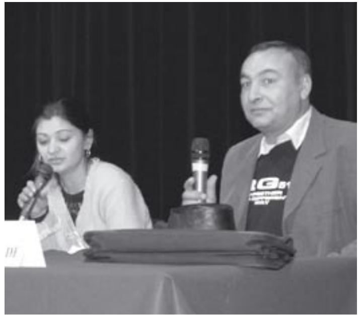
Un Rrom témoigne à la tribune...

L'idée que les Roms refusent l'école circule largement dans les milieux bien pensants. Qu'en est-il ? Certes on peut comprendre que des Roms, notamment des pokaim (nouveaux convertis des églises américaines), hésitent à soumettre leurs enfants aux propos dégradants qu'offre de nos jours toute école, surtout dans les zones où sont relégués les Roms. Ils s'élèvent de la même manière contre la télévision qui a fait des plaisanteries de corps de garde, à peine voilées, un des standards de la communication. Encore leur refus porte-t-il moins sur les mots, voire les images, que sur la banalisation de comportements qu'ils ont le droit de réprimer dans leur vision de la famille - la compréhension de l'humour au second degré de bien des facéties télévisuelles n'étant pas toujours directement perceptible pour le spectateur moyen, surtout issu d'une autre culture que celle des humoristes graveleux. Certes il y a en romani de l'humour sur tous les sujets, le problème n'est pas là, mais il a une autre élégance que