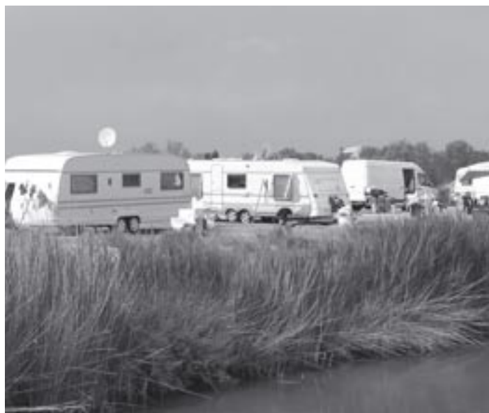
Caravanes au bord d'une roubine aux Saintes-Maries-de-la-Mer.

Souvent, les Tsiganes n'ont plus guère d'attaches possibles en dehors de communautés de parents à qui toute légitimité territoriale est refusée par la société environnante. Chercheraient-ils à s'insérer dans une région jugée plus hospitalière que celle où ils vivent, qu'ils en seraient souvent empêchés au vu de leur inadaptation aux exigences de l'économie actuelle et aux carences dont ils souffrent dans le domaine de l'instruction, ou du racisme ambiant. Et de fait, il faudrait un effort énorme en matière de formation et de scolarisation pour parvenir à la mise à niveau d'une main d'œuvre actuellement déclassée et de la jeunesse à qui celle-ci a donné