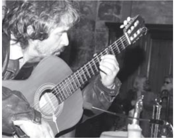
Quelques accords de guitare : la plus belle des prières pour Sainte Sara ! (photo A. L.).

- curieusement on entend encore souvent la légende des clous de la croix du Christ, clous forgés