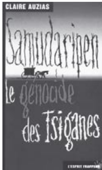
Le livre « Samudaripen, le génocide des Tsiganes » de Claire Auzias (éd. L'esprit frappeur).

C'est donc le 26 février 1943 qu'arrive dans ce camp le premier grand convoi de Tsiganes. Ils sont au nombre de deux cents, transférés depuis Buchenwald vers Auschwitz Birkenau II. Le premier mars, quelques jours plus tard, arrivait le second convoi. Et depuis cette date, les arrivées s'accélérent. Fin 1943, ils sont 18 738 Tsiganes enregistrés à Auschwitz. On compte un total de 23 000 hommes, femmes et enfants au Familienlager, camp des familles. Parmi ceux-ci, le plus fort contingent provenait d'Allemagne et d'Autriche. A la différence du traitement des Juifs, les Tsiganes ne subissaient pas de sélection à leur arrivée, mais étaient directement dirigés vers le camp des familles. Ce camp, qui fut une spécificité d'Auschwitz, dura un an et demi. Des familles tsiganes entières y étaient regroupées. Cette apparence de privilège mal compris suscita des jalousies quant au sort réservé à ces malheureux, qui certes étaient les seuls déportés à