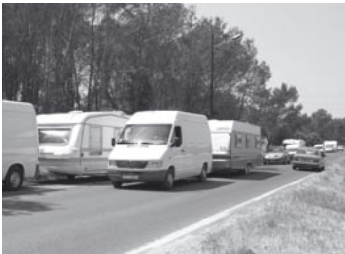
Chassés de terrain en terrain, les gens du voyage reprennent la route.

Face à la quête des Tsiganes et Gens du voyage de reconnaissance de cette singularité, de leur citoyenneté et d'une participation sociale, notre société décline en permanence une fin de non recevoir, sauf à ceux qui acceptent de