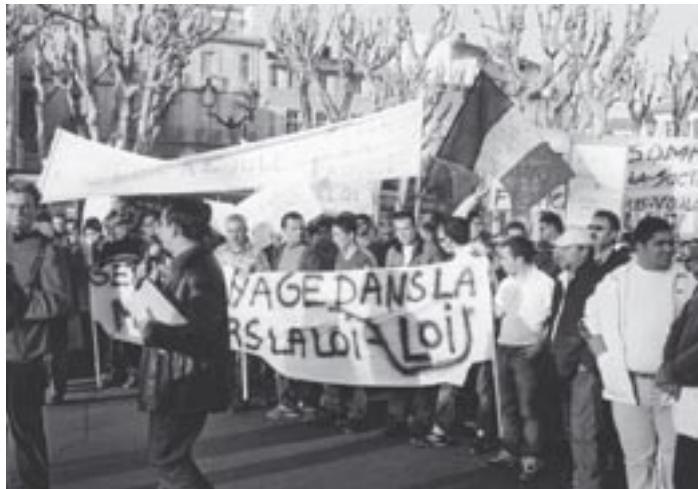
Manifestation de voyageurs pour le respect de leurs droits, à Aix-en-Provence le 15 mars 2004.

Par manque de ressources, la nourriture perd en qualité et se raréfie ; l'habitat se désagrège. Les frais de scolarisation des enfants ne sont