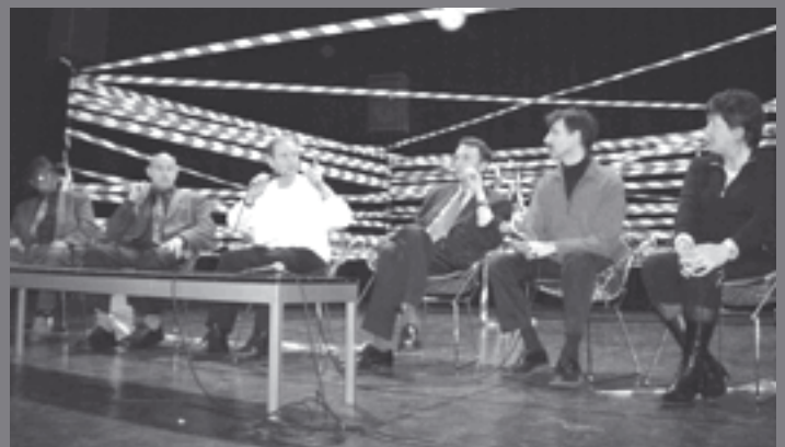
Au Phénix de Valenciennes, la représentation était suivie d'un débat animé par J.-C. Dulieu.

La première de ce spectacle a été donnée au Phénix de Valenciennes le 13 décembre 2005. Cinq autres représentations sont à ce jour prévues dans le valenciennois. La pièce a également été jouée au théâtre Massenet de Lille le 3 mars dernier. A chacune de ces occasions, le spectacle a été suivi d'un débat animé par