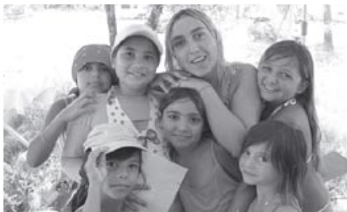
Dans les familles tsiganes, rien ne semble plus important que les enfants !

Les Manouches, les Roms, les Gitans et les Sinti forment une population d'environ dix millions d'habitants répartis dans tous les pays européens depuis plus de six siècles. Ils sont d'origine indienne. Leurs ancêtres n'étaient probablement pas tous des nomades lorsqu'ils arrivèrent dans l'empire byzantin au douzième et au treizième siècle de notre ère. Mais, pour autant qu'on puisse le savoir à travers divers témoignages, ils possédaient des atouts non négligeables qui leur permettaient de s'insérer dans l'économie des régions traversées. Sans velléité aucune de conquêtes, ils se présentaient comme artisans, artistes et commerçants, travailleurs indépendants maîtres de leur temps de travail, soucieux d'une rentabilité rapide plutôt liée à un effort ponctuel, faisant la preuve d'une