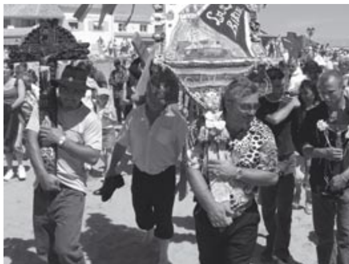
Les gens du voyage emmènent leur sainte patronne, Sara, jusqu'à la mer, le 24 mai aux Saintes-Maries.

Nous avons mentionné plus haut qu'au contraire de l'Occident qui amalgame diverses populations aux Rroms en raison de leur mobilité, l'Europe orientale pratique un tel amalgame sur la base d'une certaine exclusion sociale. C'est ainsi que les Balkano-Egyptiens (qui revendiquent peut-être avec raison une origine égyptienne et une arrivée dans les Balkans peu après la grande persécution de Dioclétien dans leur pays) et les Banyash de Croatie, Hongrie et Roumanie, peut-être apparentés aux Moëso-Roumains de Serbie du Sud, ont été catalogués « Tsiganes » par les paysans peu enclins à la rigueur scientifique. C'est une certaine marginalité socio-économique qui les a conduits à utiliser