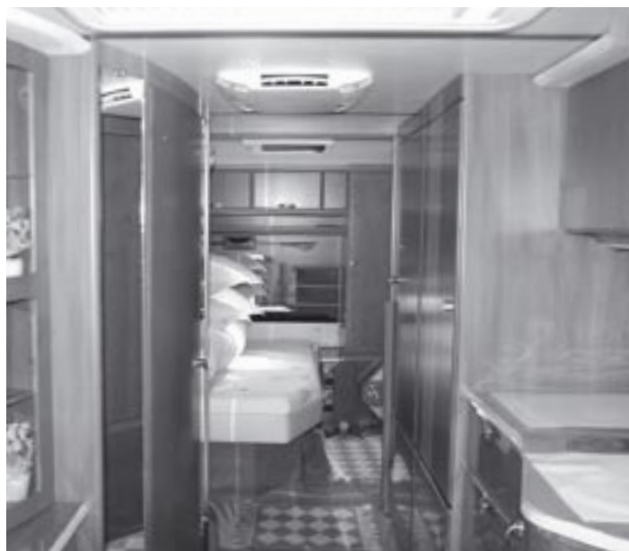
Quelques mètres carrés pour un lieu et un mode de vie qu'ils souhaitent préserver.

Depuis, et malgré la loi du 2 juillet 2000, la situation des Tsiganes et Gens du Voyage s'aggrave. Bien que cette loi, comme l'indique son titre, est « relative à l'accueil et à l'habitat des Gens du Voyage » et que son article 1 parle de personnes dont « l'habitat traditionnel est constitué de résidences mobiles », les articles suivants portent beaucoup plus sur la manière de réguler et contrôler le stationnement des familles vivant en caravane dans un souci d'ordre public, plutôt qu'ils n'apportent de réponse à l'attente d'habitat diversifié de ces familles. Ainsi, et de façon inquiétante, la prospective que trace la loi est celle d'un territoire organisé, pour les Tsiganes et Gens du