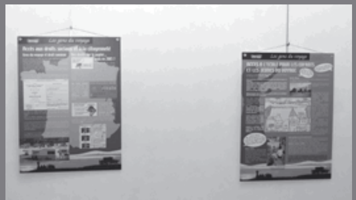
Deux sujets très importants pour l'avenir des voyageurs : l'accès aux droits et l'accès à l'école pour leurs enfants.

Filmer la parole des Tziganes : « Ce que j'ai découvert au travers de mes lectures et de mes rencontres m'a étonné, ému, révolté. Ce peuple errant, puis largement sédentarisé, est peut-être le plus persécuté de la planète. Cette persécution se poursuit de nos jours dans certains pays de l'Est de l'Europe. En Occident et en France en particulier, il n'est évidemment plus question de persécutions physiques, mais c'est de rejet qu'il s'agit. Et ce rejet est fondé sur l'ignorance qui entraîne la peur. On parle des Tziganes comme s'ils appartenaient à une ethnie homogène. Ils sont, en fait, tous semblables et tous différents.